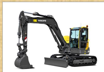
・車種：ECR88D ・容量：0.333 m 3 ・年式：2023年