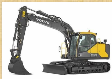
車種：EC140E 容量：0.52 m 3 年式：2023年