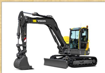
車種：ECR88D 容量：0.266 m 3 年式：2022年 その他：ツピースチーム