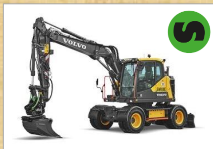
車種：EWR130E 容量：0.55 m 3 （グレーディングバケツ） 年式：2023年、2024年 その他：フィルローター付