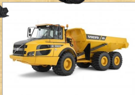
車種：A25G 積載量：25,000kg 積載容量：15.3 \text{m}^3 年式：2023年、2024年