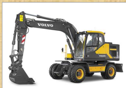
・車種：EW140E ・容量：0.57 m 3 ・年式：2023年