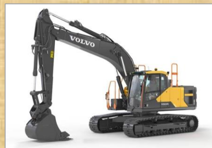
車種：EC200EL 容量：0.75 m 3 （細バケツ） 年式：2023年