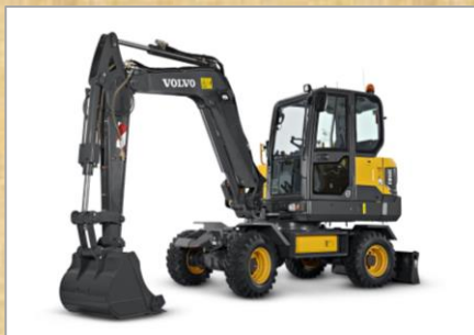
車種：EW60E 容量：0.068 m 3 、0.176 m 3 年式：2023年