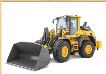
車種：L60H 容量：2.0 m 3 年式：2022年、2023年